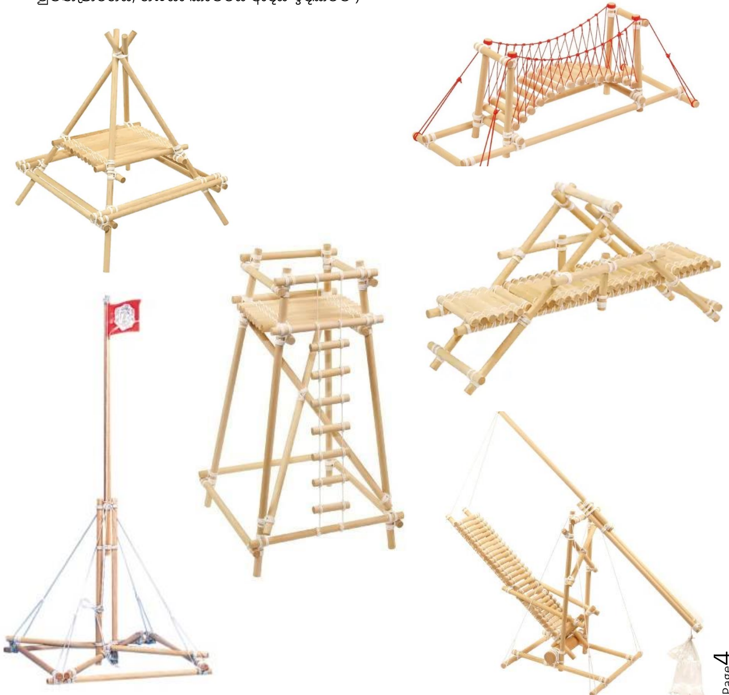
කොළඹ දිසා වැඩසටහන් මණ්ඩලය - ජනාධිපති බාලදක්ෂ ප්‍රදානය

පුරෝගාමී ව්‍යාපෘතියක් සංවිධානය කිරීමේ නායකත්වය දැරීම. ( පාලම් ,නිරීක්ෂණ කුළුණු ,තුරුමත කුටි,කාලීන උපකරණ , පිවිසුම් දොරටු සංකීර්ණ, ඔන්විල්ල, සීසෝ, කඳවුරු මුළුතැන්ගෙය, ගබඩා කාමරය ආදිය ඉදිකිරීම )