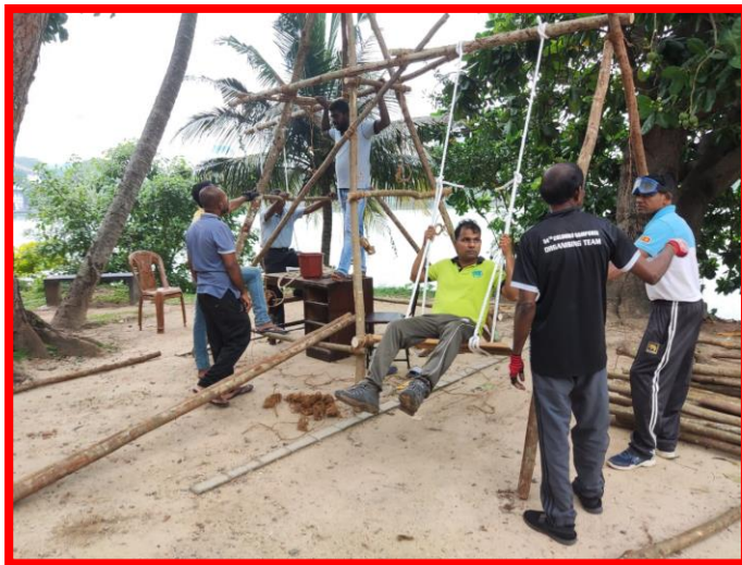
කොළඹ දිසා වැඩසටහන් මණ්ඩලය - ජනාධිපති මාලදක්ෂ ප්‍රදානය